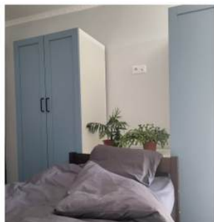
LENJERII DE PAT