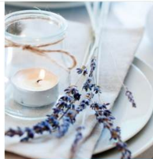
SET DE MASĂ