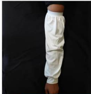
PROTECȚIE DE BAZĂ